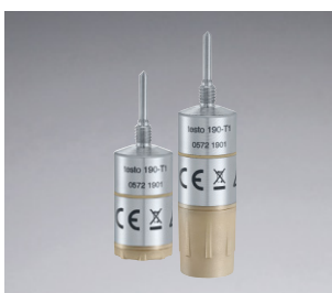
Grote of kleine batterij