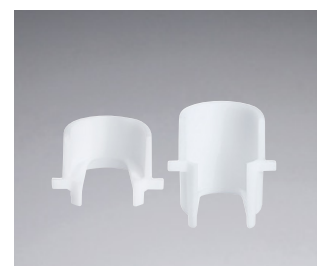
Afstandadapter kort of lang