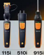
115i 510i 915i

Für schnelle Parallelmessungen: die testo Smart Probes