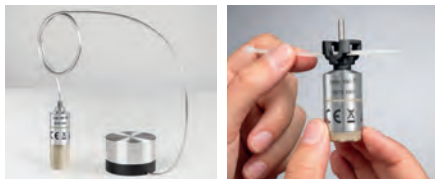
Držák lyofilizační sondy