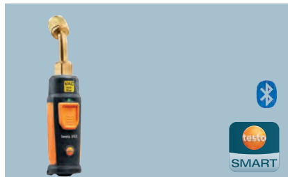
testo 552i Bezdrátová vakuová sonda