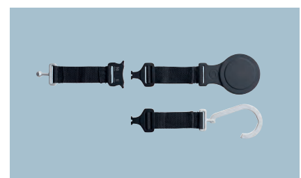
Magnetický popruh pro digitální servisní přístroje testo 557s/550s/550i