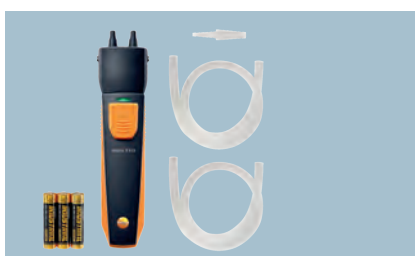
testo 510i Bezdrátový diferenční tlakoměr