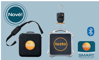
testo 560i Digitální váha v sadě pro chlazení s chytrým ventilem + taška