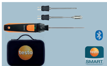
testo 915i Bezdrátová teplotní sada