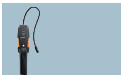
testo 316-3 Detektor úniku chladiva