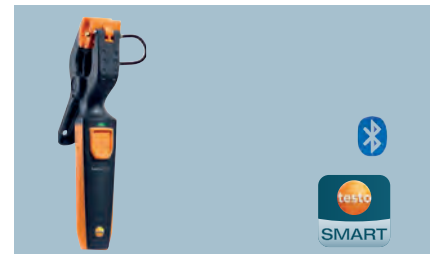
testo 115i Bezdrátový teploměr