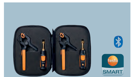
Chytré sondy testo Sada chlazení

2x testo 115i / 2x testo 549i 1 x chytré pouzdro testo