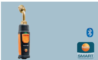
testo 549i Bezdrátový přístroj pro měření vysokého tlaku