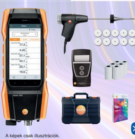
A képek csak illusztrációk.