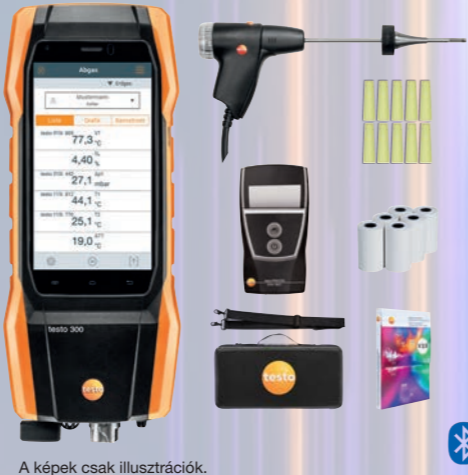
A képek csak illusztrációk.