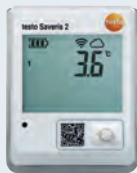
testo Saveris 2-T1

Todos los data loggers están certificados por el HACCP