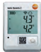
testo Saveris 2-T2