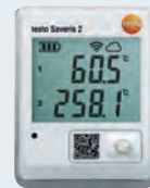
testo Saveris 2-T3