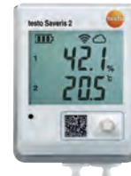
testo Saveris 2-H2