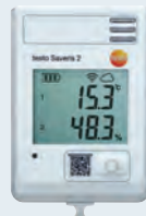
testo Saveris 2-H1

Todos los data loggers están certificados por el HACCP