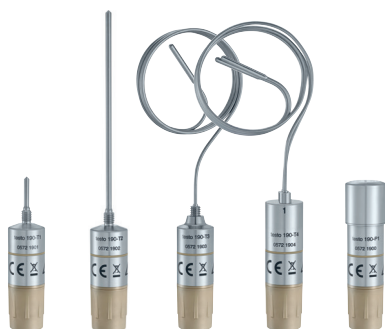
testo 190 rejestratory CFR

Walidacja procesów sterylizacji i liofilizacji jest kluczowym elementem zapewnienia jakości i gwarancją wysokiego poziomu bezpieczeństwa Twoich produktów. Dzięki naszemu kompletnemu rozwiązaniu pomiarowemu testo 190 otrzymasz pełne wsparcie w zakresie spełniania wszystkich wymagań prawnych i jakościowych.