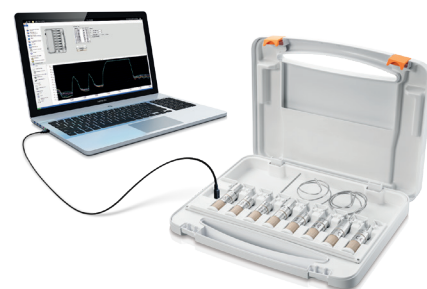
testo 190 oprogramowanie CFR