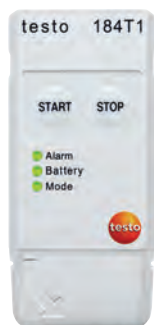
testo 184 T1