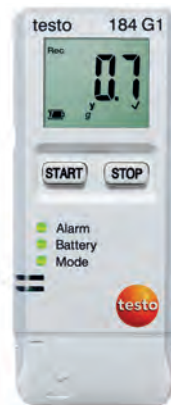
testo 184 G1