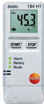
testo 184 H1