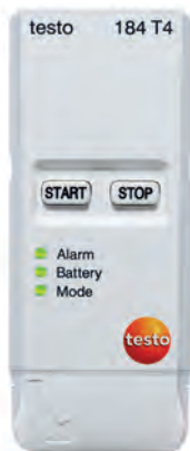
testo 184 T4