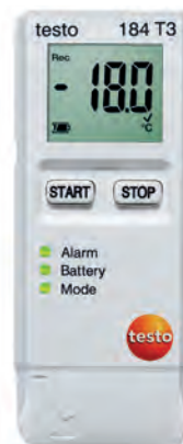
testo 184 T3