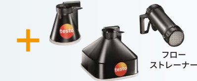
フローストレーナー