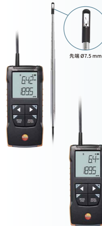
先端 Ø7.5 mm

testo 425 は、風速・風温・風量を測定可能な熱線式風速計です。プローブは最大 820 mm に伸縮するため、高所や大口径ダクトの測定にも最適です。低風速域(〜5 m/s)の測定に優れており、すべての測定範囲で 0.01 m/s の分解能を維持します。本体内蔵の気圧センサの測定値をもとに自動的に補正された風速を表示するため、測定後の補正計算が不要です。