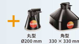
丸型 Ø200 mm 角型 330 × 330 mm