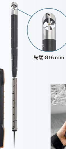
先端 Ø16 mm

testo 416 は、風速・風量を測定可能なベーン式風速計です。プローブの先端は直径 16 mm で、最大 850 mm に伸縮するため、高所や大口径ダクトの測定にも最適です。中風速域(5 ~ 40 m/s)において熱線式風速計よりも精度が高いことが特徴です。また、熱線式と異なり、温度や気圧(空気密度)の影響を受けません。