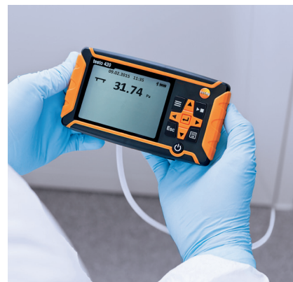
Misura della pressione differenziale con tubo flessibile di collegamento