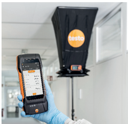
Misura e gestione dei dati con testo 400