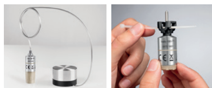
Voelerhouder vriesdroging Clip

Gewoon veilig: 100 % hermetisch dichte meettechniek – ook na vervangen van de batterij.