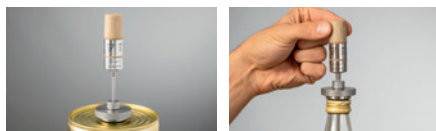
Dosen- und Flaschendurchführung