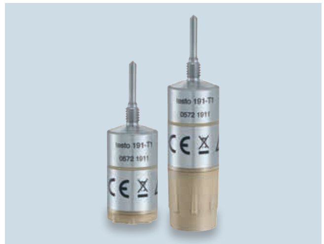
两种电池版本中的testo 191-T1数据记录仪

该系统的世界级创新极大地便利了食品行业质量监督员的工作：数据记录仪的电池和测量技术包含在两个独立的外壳中，螺旋盖使得这两种电池在没有任何工具的前提下，都可以快速轻松地更换。且电池更换后，记录仪仍保持100%密封。