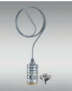
特别深的罐/瓶内温度测量： testo 191-T3 + 罐和瓶附件