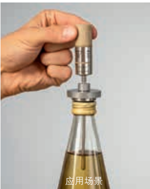
罐/瓶内温度测量，外置记录仪： testo 191-T2+连接罐体和瓶附件