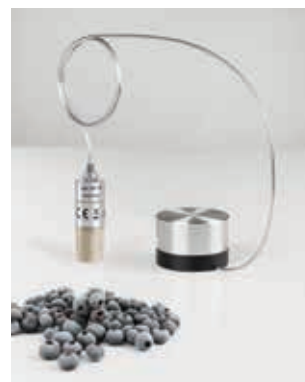
冷冻-干燥过程中的温度测 量： testo191-T3/-T4+冷冻-干燥 探头架