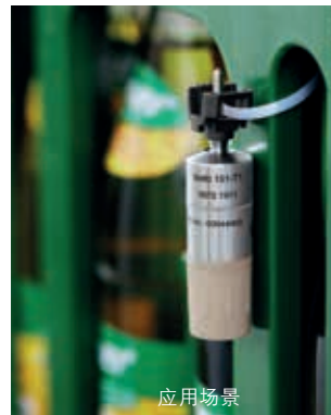
环境温度测量： testo 191-T1+固定夹和扎带 (扎带不包括在交货范围内)