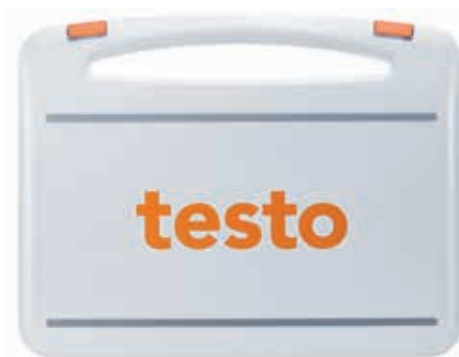
多达8个数据记录仪的多功能箱

带有集成编程和读数单元的运输箱也可用于同时对多达8个数据记录仪进行配置和读数。配置和读数由USB通过testo 191专业软件完成执行。这里有多功能箱和其里面记录仪的图像。只剩下设置好相关参数-现在就可以使用了。