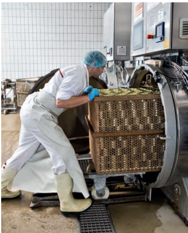
为罐装香肠进行高压灭菌

为了满足这些要求，质量监督员通常依靠由数据记录仪和软件组成的系统解决方案。然而，由于这些设备通常难以操作且易磨损，导致我们的日常工作比必须要做的难度更大。