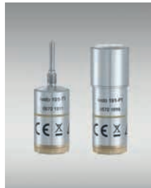
高压灭菌和巴氏杀菌中的灭菌 温度和压力测量： testo 191-T1 + Testo 191-P1