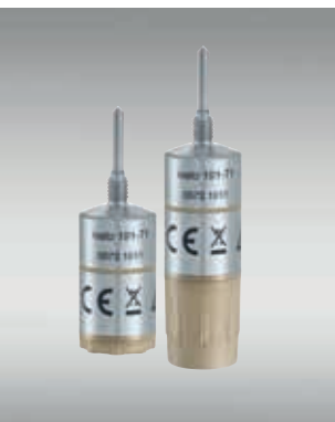
根据应用，您可以通过我们 灵活的电池大小改变记录仪 尺寸。