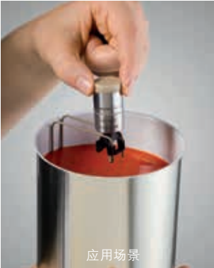
罐体中的温度测量： testo 191-T1+支架