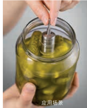
直接在食物中测量温度： testo 191-T1