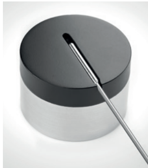
Fühlerhalterung Gefriertrocknung (Puck)