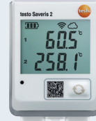
testo Saveris 2-T3