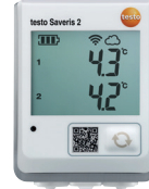
testo Saveris 2-T2