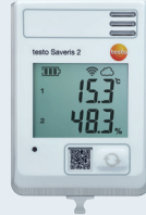
testo Saveris 2-H1