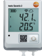
testo Saveris 2-H2