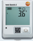
testo Saveris 2-T1