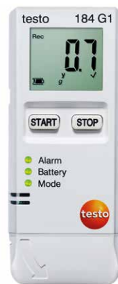
testo 184 G1