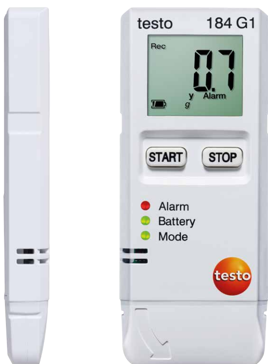
Abbildung in Originalgröße

Alle Vorteile der Datenlogger testo 184 auf einen Blick.