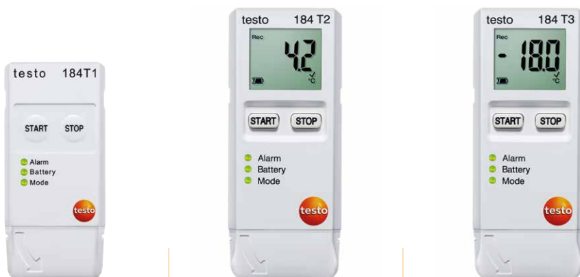
testo 184 T1