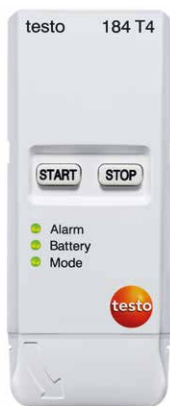
testo 184 T4