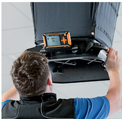
Neig- und abnehmbares Display