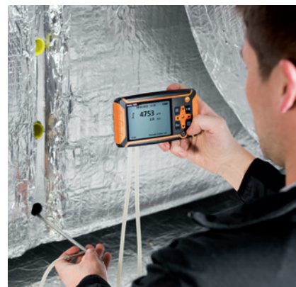
Stauohrmessung im Kanal