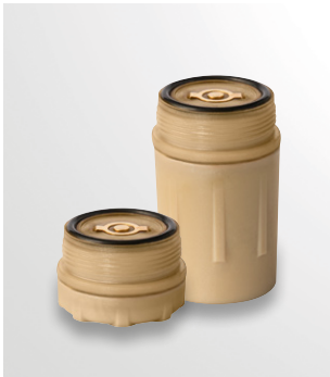
Kleine of grote batterij verkrijgbaar