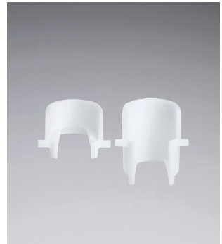
Adaptateur de distance court / long