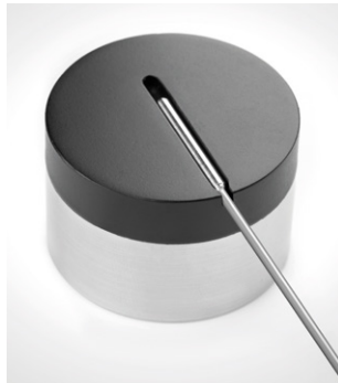
Support de sonde pour lyophilisation (puck)