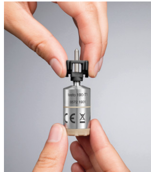
Étrier de retenue