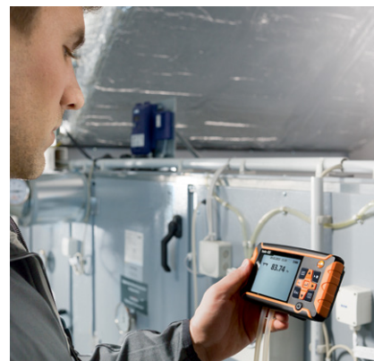
Mesure de la pression différentielle avec tuyau de raccordement