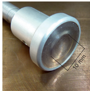
Messfläche Ø 10 mm

Es empfehlen sich Messgeräte mit einem Mini TE-Eingang für Thermoelement Typ K wie z. B. testo 480, testo 735, testo 925, Testo Datenlogger, testo Saveris.