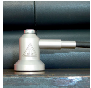
Plan aufliegende Fläche mit seitlichem Abgang (Leitung oder Teleskop).

Gerne passen wir Fühler auch an Ihre individuellen Anforderungen an. Schreiben Sie uns dazu bitte einfach ein Mail an: vertrieb@testo.de .