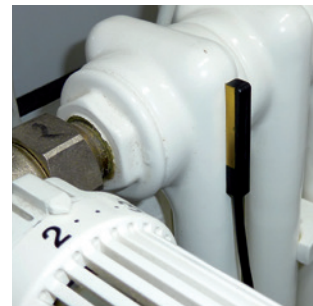
Messung am Heizkörper

Gerne passen wir Fühler auch an Ihre individuellen Anforderungen an. Schreiben Sie uns dazu bitte einfach ein Mail an: vertrieb@testo.de .