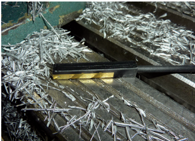
Ermittlung der Temperatur, die in die Ausdehnungskompensation einfließt.

Es empfehlen sich Messgeräte die Pt100 auswerten können und die einen mit Mini-DIN-Eingang besitzen, wie z. B. testo 720, testo 735, testo Logger, testo Saveris.