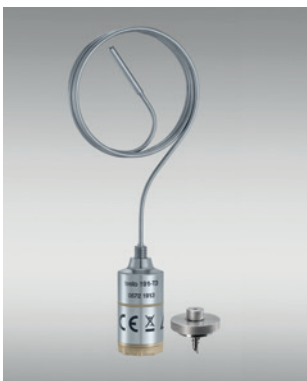
Mesure de température dans des boîtes et bouteilles très profondes : testo 191-T3 + fixation pour boîtes et bouteilles