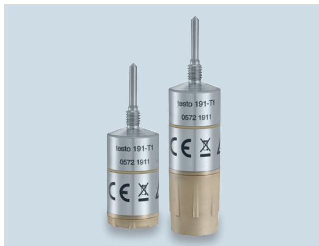
L'enregistreur de données testo 191-T1 avec les deux types de pile.

Une nouveauté mondiale du système facilite le travail des responsables de la qualité dans l'industrie agro-alimentaire de manière déterminante : la pile et les composants de mesure des enregistreurs de données sont logés dans deux boîtiers séparés. Grâce au raccord vissé, les deux types de pile se changent facilement, rapidement et sans le moindre outil. Et les enregistreurs restent entièrement étanches après le changement de pile.