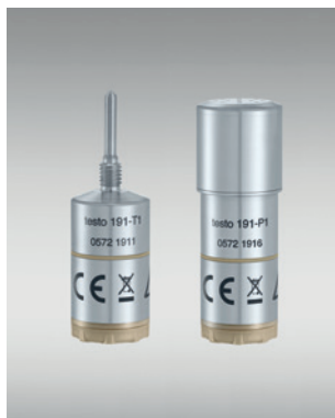
Mesure de température et de pression lors de la stérilisation dans les autoclaves : testo 191-T1 + testo 191-P1