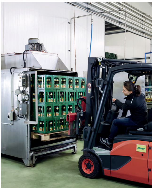
Pasteurisation de boissons aux fruits.