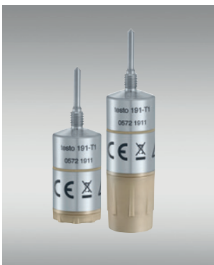
Grâce à notre concept de pile flexible, vous pouvez varier la taille de l'enregistreur en fonction de l'application.