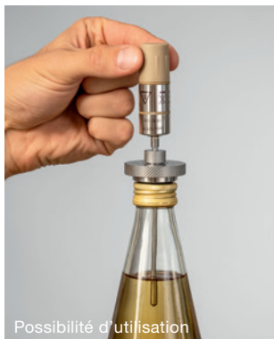
Mesure de température dans une boîte/bouteille avec montage externe de l'enregistreur : testo 191-T2 + fixation pour boîtes et bouteilles