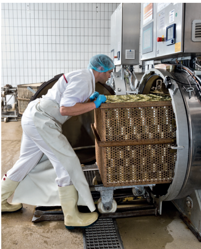
Autoclavage de conserves de charcuterie.

Pour répondre à ces exigences, les responsables de la qualité se fient généralement aux systèmes d'enregistreurs de données et de logiciels. Mais ces solutions sont souvent compliquées à manipuler et sujettes à l'usure ce qui complique inutilement le travail quotidien.