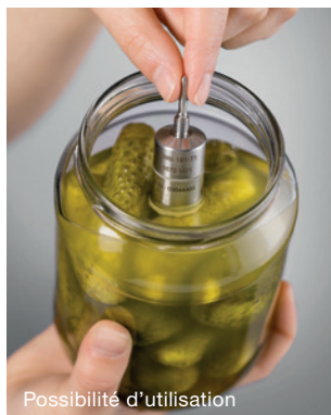
Mesure de température directement dans l'aliment : testo 191-T1