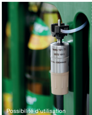
Mesure de la température ambiante : testo 191-T1 + étrier de retenue et serre-câble (serre-câble non fourni)