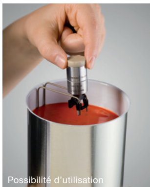
Mesure de température dans une boîte : testo 191-T1 + support