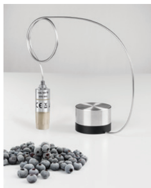
Mesure de température lors de la lyophilisation : testo 191-T3/-T4 + support de sonde pour lyophilisation