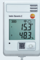
testo Saveris 2-H1