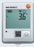
testo Saveris 2-T1