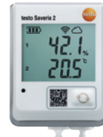
testo Saveris 2-H2