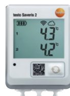
testo Saveris 2-T2