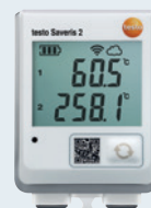
testo Saveris 2-T3