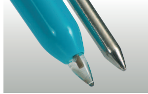
testo 206-pH2: yarı-katı gıdalar için pH2 prob başlığı