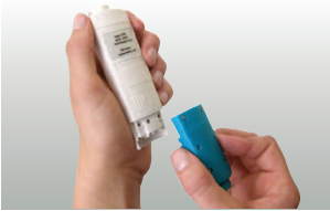
testo 206-pH1/-pH2/-pH3 probuları kolayca değiştirilebilir