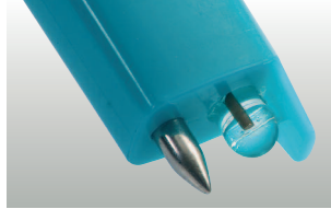
testo 206-pH1: sıvılar için pH1 prob başlığı