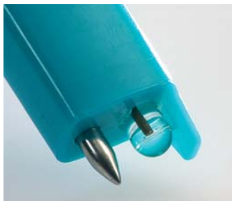
Głowica sondy pH1 do cieczy

Pomiary wartości pH odgrywają istotną rolę w wielu aplikacjach. Wszędzie, gdzie zachodzą chemiczne i biochemiczne reakcje, wartość pH jest znaczącą wartością przy ocenie takiej reakcji.