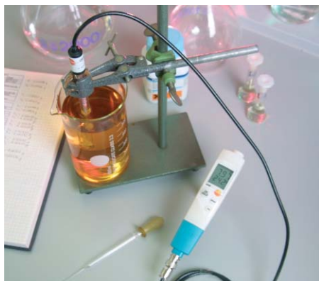
testo 206-pH3 umożliwia podłączenie zewnętrznych sond pH