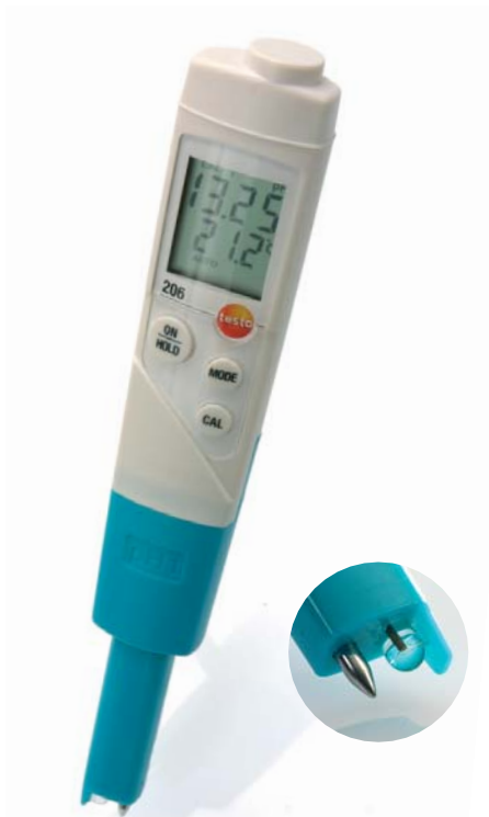
głowica sondy pH1 do cieczy