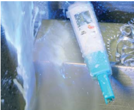
Futerał TopSafe - zabezpieczenie miernika w trudnych, przemysłowych warunkach