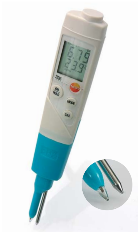
głowica sondy pH2 do produktów półstałych