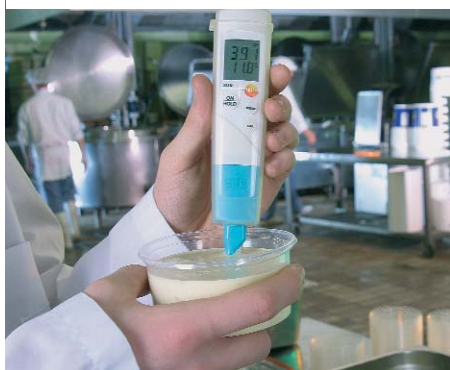
testo 206-pH2 idealny do pomiarów w substancjach lepkich