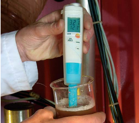
testo 206-pH1 idealny miernik do pomiarów w cieczach