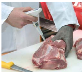
Szybki i wygodny pomiar podczas produkcji