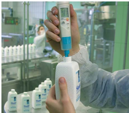
Automatyczna funkcja zatrzymywania wyniku informuje o stabilizacji pomiaru