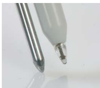
Końcówka zatopiona w odpornym na uszkodzenia plastiku