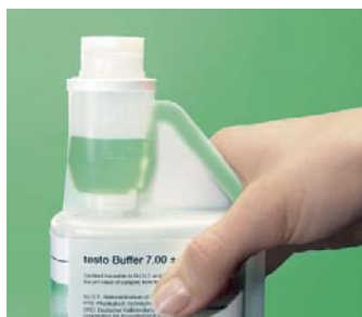
Roztwór buforowy pH z dozownikiem