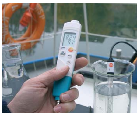
Automatyczna kompensacja temperatury z zewnętrznymi elektrodami, zintegrowanymi z sondą temperatury