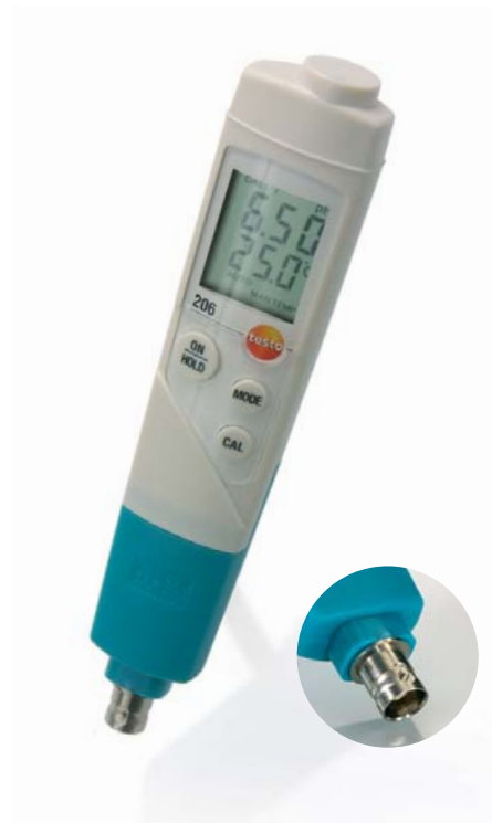
głowica sondy pH3 ze złączem BNC