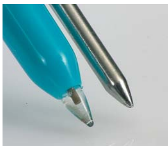
Głowica sondy pH2 do produktów półstałych

Razem z ekspertami, którzy wykonują pomiary pH w szeroko rozumianym przemyśle, firma Testo rozwiązała te problemy poprzez zastosowanie innowacyjnych rozwiązań.