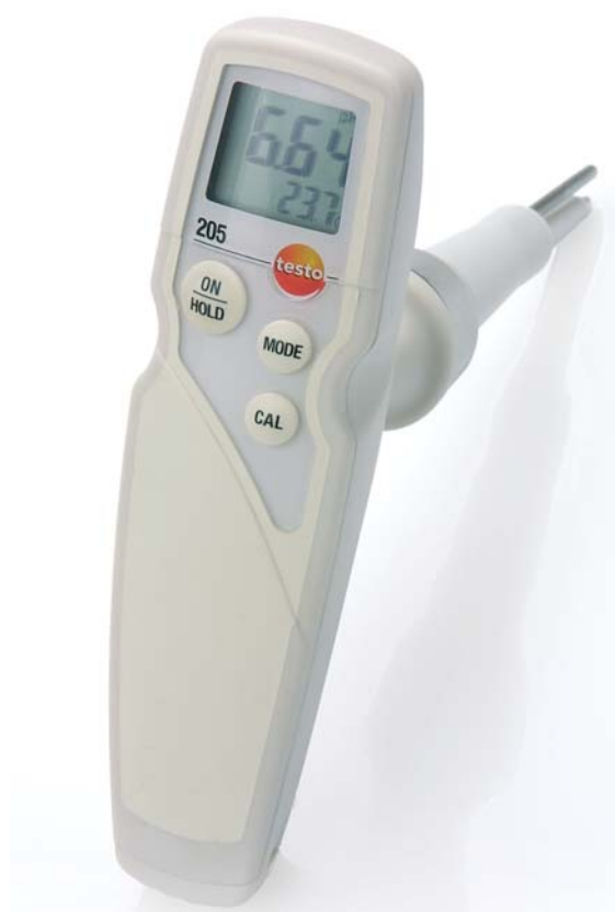
Mocnej konstrukcji miernik pH/C do żywności, z automatyczną kompensacją temperatury.