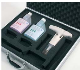
Zestaw walizkowy z testo 205, buforami pH 4.0 i 7.0, pojemnikiem z żelam