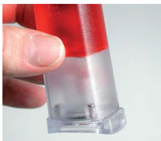
Żelowy roztwór chlorku potasu - brak możliwości rozlania lub wycieku