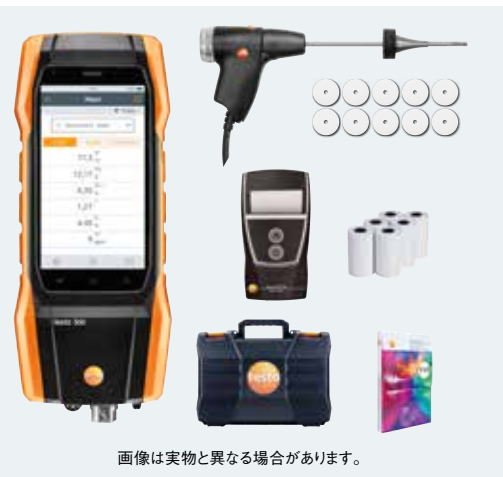
画像は実物と異なる場合があります。