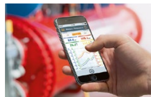
専用モバイルアプリ 無料ダウンロード (iOS/Android)