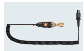
外付け真空プローブ