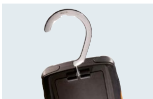
吊り下げ用フック