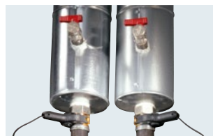
クランプ温度プローブ