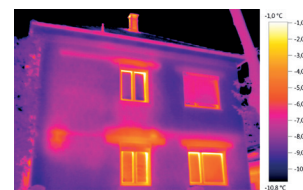
Hőkép a testo SkálaAsszisztens alkalmazásával