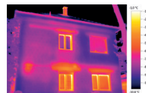
Image thermique avec testo ScaleAssist