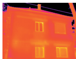
Image thermique sans testo ScaleAssist

L'échelle de température et les couleurs des images thermiques pouvant être adaptées individuellement, il est possible, p. ex., de mal interpréter le comportement thermique d'un bâtiment. La fonction testo ScaleAssist résout ce problème en adaptant la répartition des couleurs de l'échelle aux températures intérieure et extérieure de l'objet de mesure, ainsi qu'à leur différence. On obtient ainsi des images thermiques sans erreur et comparables de manière objective.