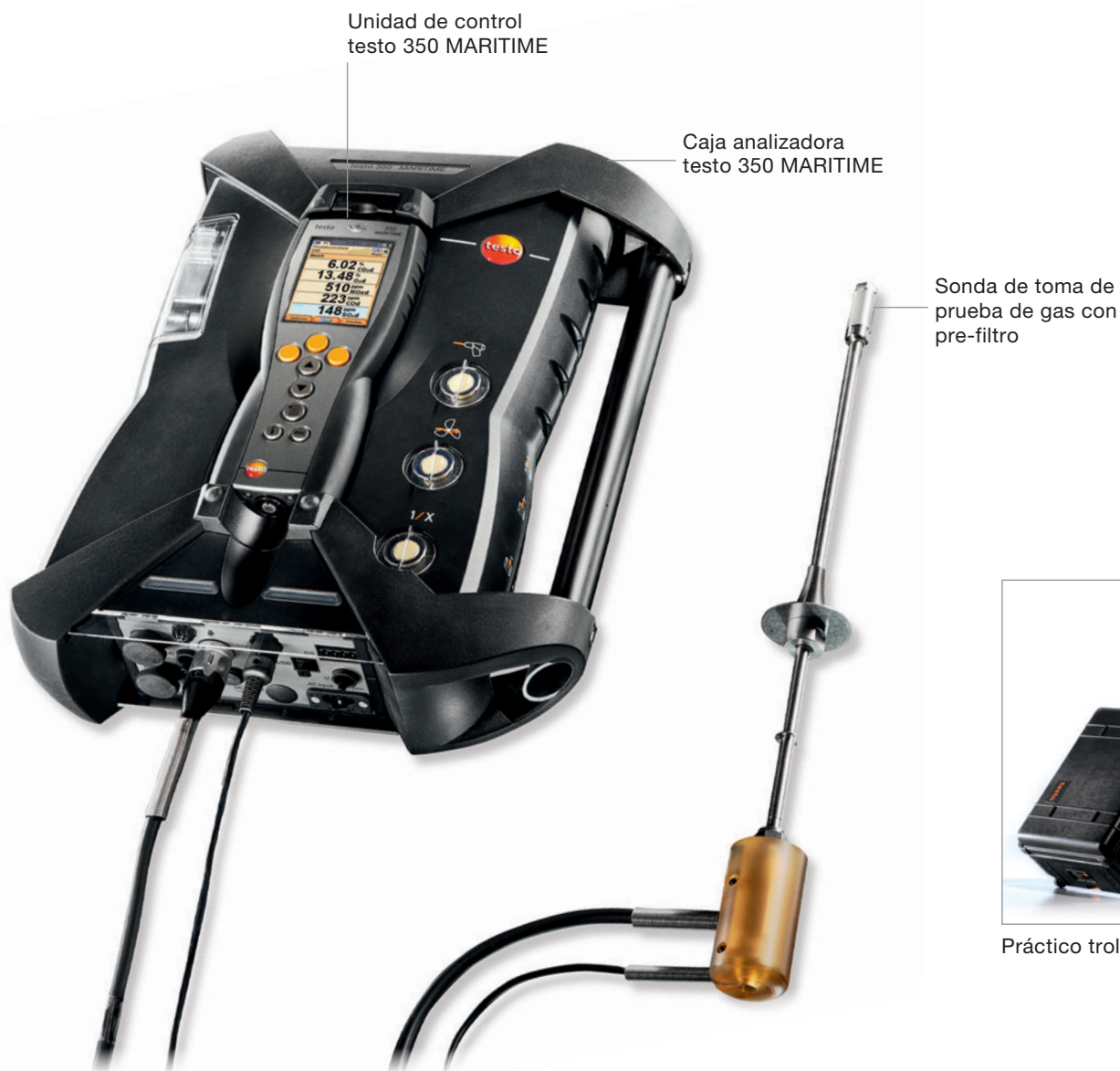
Unidad de control testo 350 MARITIME

Por otra parte, con el testo 350 MARITIME es posible también la medición de NOx como comprobante en zonas regionales especiales.