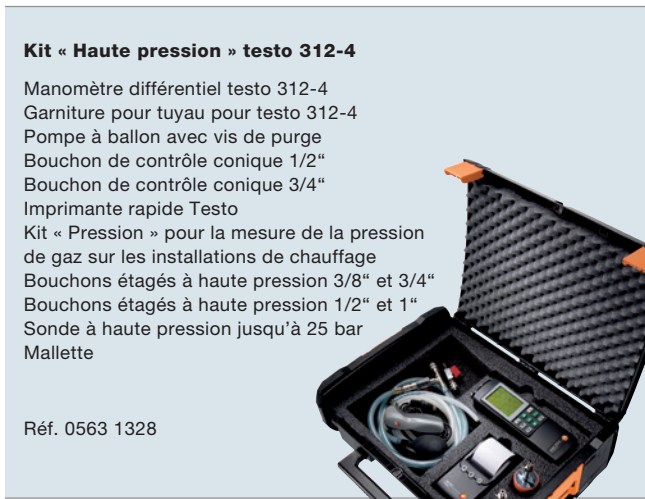
Imagen no vinculante