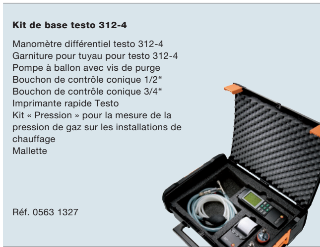
Imagen no vinculante