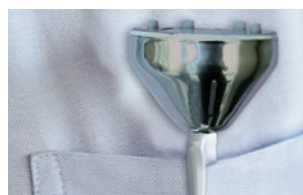
Tube de protection avec clip. Toujours là, prêt à être utilisé à tout moment.