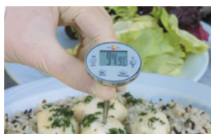
Pour mesurer la température des échantillons dans le secteur agroalimentaire