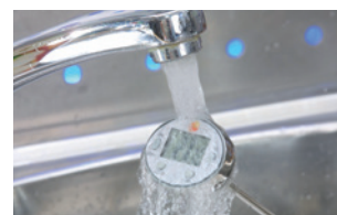
Rincer simplement sous l'eau courante en cas d'encrassement.