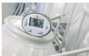
Résistant au lave-vaisselle.