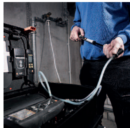
Contrôle de mise en charge