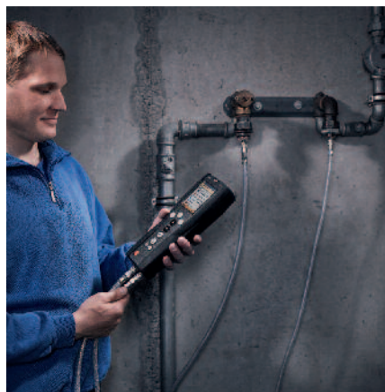
Contrôle automatisé sans dispositif d'injection