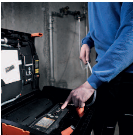
Contrôle d'étanchéité automatique