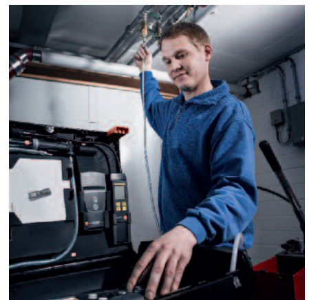
Contrôle des conduites d'eau sanitaire et usées