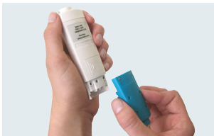
Einfache Sondentauschmöglichkeit bei testo 206-ph1/-ph2/-ph3