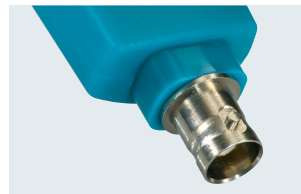
testo 206-pH3: pH3-Sondenkopf mit BNC-Schnittstelle