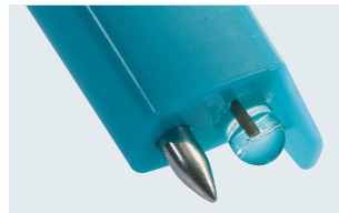
testo 206-pH1: pH1-Sondenkopf für Flüssigkeiten