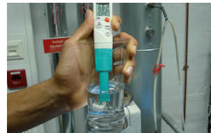
Ideal geeignet zur Überprüfung von Heizungswasser gemäß VDI 2035.