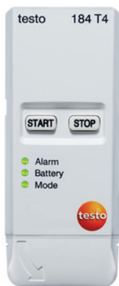
testo 184 T4