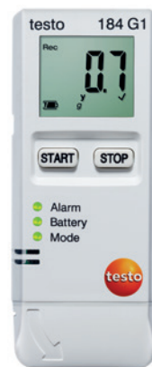
testo 184 G1