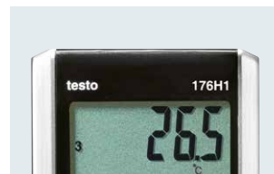
Großes und übersichtliches Display zur Messwertanzeige