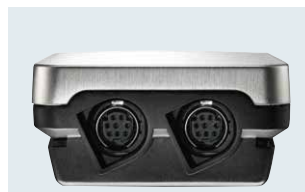
Fühleranschlüsse am unteren Gehäuseende für zwei Temperatur-/Feuchtefühler