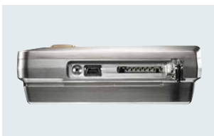
Seitlicher Anschluss von Mini-USB-Kabel und SD-Karte